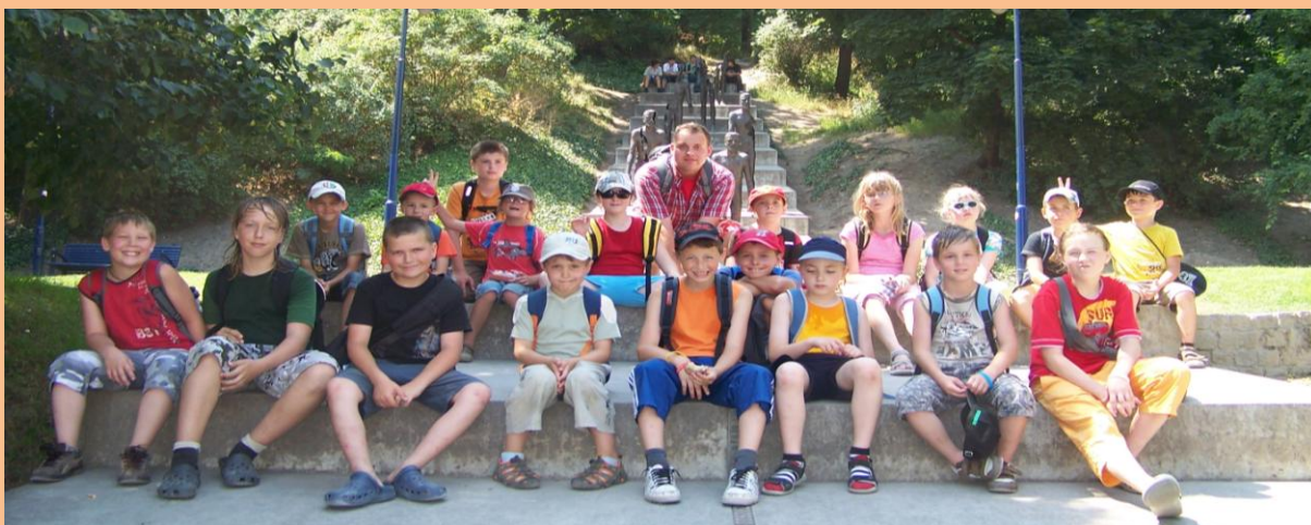
Obrázek 9: V centru Prahy

Posledním úkolem dětí byla, stejně jako včera, výroba novin. Děti se rozdělily do čtyř skupinek a v nich tvořily „noviny“ na veliký papír. Vystříhovaly a nalepovaly, kreslily a psaly vše, co pro ně bylo dnes typické a zajímavé, prostě vše, na co si vzpomenu, když se řekne Asie. Své výtvary si potom také prezentovaly. Už nám tedy nic nebránilo k zpětné vazbě a svěřili jsme plyšové kryse, co se nám dnes líbilo či naopak nelíbilo. Hodnocení bylo vesměs kladné, to znamená, že se už nemůžeme dočkat na další den, který si opět všichni užijeme. A to tentokrát ve stylu Ameriky.