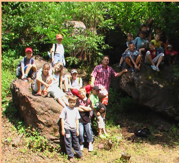
Obrázek 10: Divoká Šárka

Divoká Šárka je nejzachovalejší přírodní celek v Praze. Pestrý členěný reliéf vystupuje v četné skalní výrostky. Cestou v Šáreckém údolí jsme zabrouzdali k pramenu Šárky a letmo si zahráli geocaching. Jako správní objevitelé jsme si ukoristili jeden malý pokládek. Po krátké odbočce jsme pokračovali po značené stezce