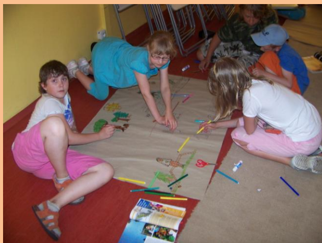
Obrázek 5: Výroba novin

Poslední aktivita dne byla zdokumentovat dnešní den – vytvořit jakési noviny o dnešku. Ve skupinkách mohly děti malovat, kreslit, nalepovat výstřižky z novin či přidat svůj vlastní komentář na velký arch balicího papíru. Práce ve skupinkách probíhala naprosto dokonale a všem se výtvořily moc povedly.