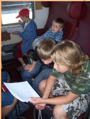
Obrázek 12: Kvíz ve vlaku

Dnes jsme si kapku přivstali, protože sraz na Domečku byl už v 7 hodin. A proč? Protože nás čekal výlet do jihlavské zoo. Některé děti byly tak nedočkavé, že už před 7h stály před domečkem. Jiné přišly včas a naštěstí nikdo nepřišel pozdě. Vyrazili jsme na metro a rovnou, s jedním přestupem na Florenci, na Hlavní nádraží. Rychle jsme se zorientovali, odkud nám jeden vlak a šli jsme na nástupiště. Rychlík dorazil a my se mohli „naskládat“ do kupé. Aby se děti nenudíly, připravili jsme jim malý, ale trochu těžší, kvíz. Poté se pokoušely hádat z kartiček zvířátka z celého světa. Dvě hodiny utekly jako voda a my dorazily do Havlíčkova Brodu, kde na nás čekal motoráček, který nás svezl až do Jihlavy.