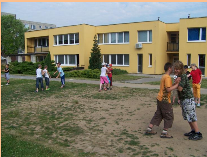
Obrázek 1: Pády důvěry

Po seznamovacích hrách jsme se přemístili na zahradu, kde jsme se pustili do aktivit založené na důvěře toho druhého. Kolotoč jednotlivých aktivit jsme spustili pády ve