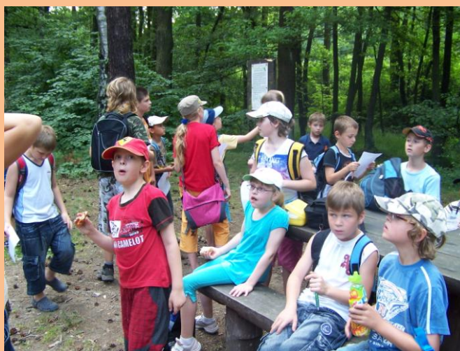
Obrázek 2: Klánovická naučná stezka

Když jsme se vrátili zpátky na naše hlavní stanoviště, sbalili jsme se svačinu, pití a vyrazili směrem na autobus, který nás odvezl na vlakové nástupiště v Dolních Počernicích. Odtud jsme popojeli dvě stanice, do zastávky Praha – Klánovice. Tady začínal náš hlavní program dne – Po stopách naučné stezky Klánovickým