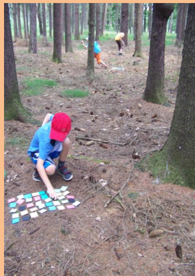
Obrázek 4: Pexeso

Přes oběd jsme zakotvili na odpočívadle a dali si svačinu. Na zpáteční vlak jsme museli přidat pořádně do kroku, protože se všichni těšili na zmrzlinu a nikomu se nechtělo čekat na další vlak. Ten náš spoj jsme nakonec opravdu stihli. Celý výlet po Klánovickém lese trval 5 hodin a nachodili jsme něco málo okolo 12 km. Je pravda, že to byl skvělý výkon. Někteří si po tomto výletu dokonce ustlali i v autobuse MHD.