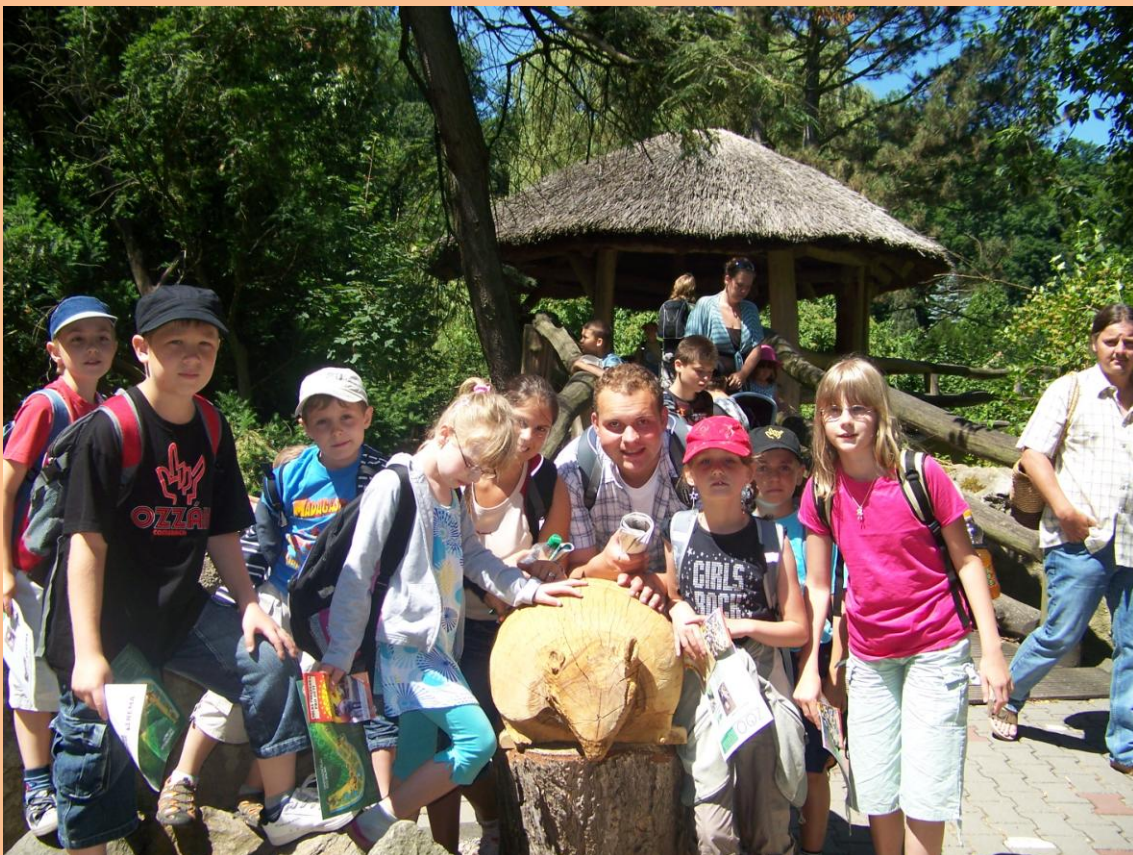
Obrázek 14: Fotka u pásovce

Rychle jsme se vydali na cestu zpět do centra Jihlavy a na autobusové nádraží. Zde jsme chvíli čekali, protože náš autobus měl zpoždění, ale nakonec jsme se dočkali. V autobusu o nás bylo dobře postaráno. Kdo chtěl, mohl si poslouchat hudbu nebo si číst. Všem nám bylo nabídnuto pití a horká čokoláda to vyhrála na plné čáře. Cesta byla velice rychlá a bez kolon, tak jsme v 16:30 byli na autobusovém nádraží na Florenci. Museli jsme pospíchat do domečku, abychom nepřišli pozdě. Nicméně dopravu jsme neovlivnili, tak trochu zpoždění bylo. Africký den utekl jak voda a nás zítra čeká už poslední společný den.