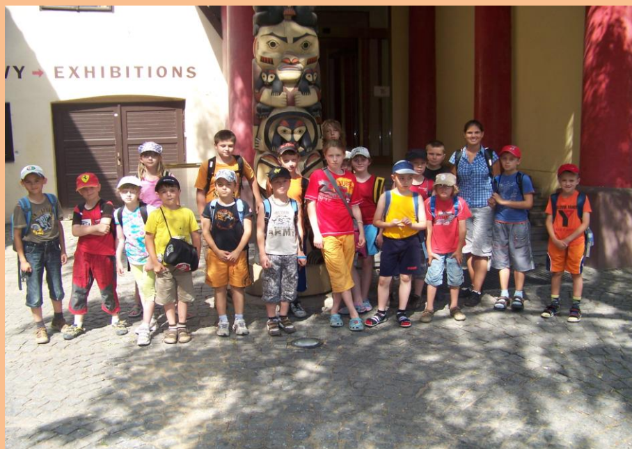
Obrázek 7: Náprstkovo muzeum

vyřezaný totem, u kterého jsme se také vyfotili. Poté nám už nic nebránilo projít všechna patra muzea. Výstava nástrojů domorodých kmenů z Austrálie a Ameriky byla velice zajímavá a děti byly okouzleny