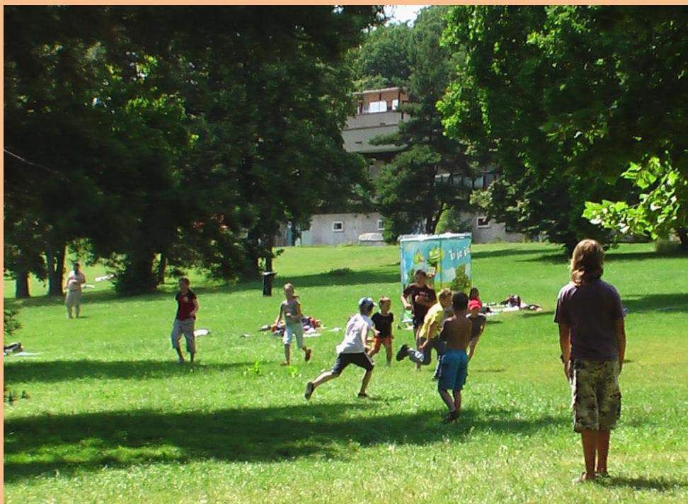
Obrázek 11: Pašeráci

vydali na přírodní koupaliště Džbán. Jelikož bylo krásné a teplé počasí, voda nám přišla vhod. Převlékli jsme se do plavek a hurá do vody. Jelikož slunce hrálo až až, i menší chladivé občerstvení v podobě nanuku přišlo vhod. Na louce jsme si před odchodem zahráli na Pašeráky a pak jsme svižným krokem vyrazili zpátky na tramvaj, abychom včas přijeli do domečku.