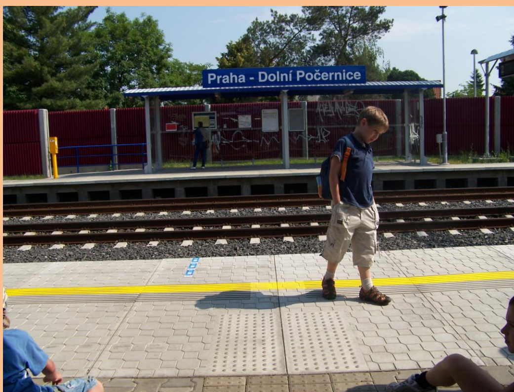
Obrázek 6: Na nádraží směr Klánovice

V závěrečných minutách jsme si udělali závěrečnou zpětnou vazbu. Díky kouzelnému tučňákovi jsme mohli bez ostychu říct ostatním, co se nám dneska líbilo nebo nelíbilo. Většina hodnotila program kladně, měli radost, že strávili den v lese a že si zahráli pár her a vyřádili se na dětském hřišti. Moc se těšíme na zítřejší den i program...věříme, že bude probíhat stejně dobře jako ten dnešní.