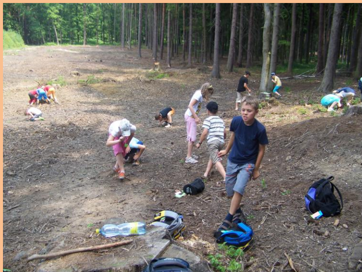
Obrázek 3: Motýli

Během putování jsme si zahráli na rozptýlení i pár her: Na motýly a Číselné pexeso.