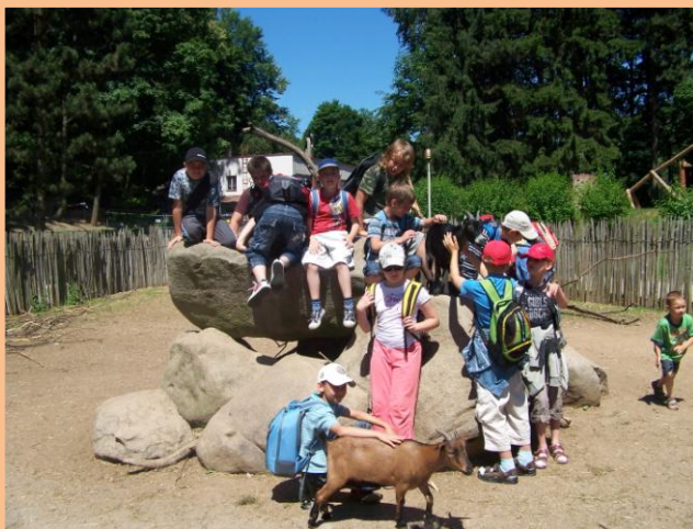
Obrázek 13: Africké kozy

V Jihlavě jsme se kapku víc prošli, než jsme našli ZOO. Nakonec se nám ji ale povedlo najít a my se mohli vrhnout mezi zvířátka. U vchodu jsme dostali plánek ZOO, takže jsme se všichni bezpečně orientovali. Začali jsme u levhartů a rysů, kteří klidně polehávali v ohradách. Ani kupa dětí je ani trochu nerozházela. Dále jsme šli k nosálům, mývalům a lemurům, u kterých jsme si nakrmili vodní ptactvo. Došli jsme ke stánkům s občerstvením, tak jsme si dali chvíli pauzu na oběd, kdo chtěl, mohl si koupit zmrzlinu. Následovala africká vesnička, která bez pochyby všechny upoutala svým výběhem koz, kam jsme mohli jít. Kozy se vůbec nebáli, tak jsme si je hladili a několikrát i vyfotili. Kousek vedle byl domeček, v němž se odvážlivci mohli podívat na netopýry volně zavěšené na větvích. Dále nám africká vesnička nabídla ukázkou typických afrických přibytků a africké školy. Po prohlídce vesničky jsme šli kousek vedle na dětské hřiště, kde děti nejvíce zaujala obrovská, točitá klouzačka. Čas nás pomalu začal tláčit, tak jsme se museli vydat zpět na vlakové nádraží. Cestou jsme ještě zhlédli klokaný a medvědy. Někomu ale zaujali také kaktusy a jiné exotické rostliny v obchůdku.