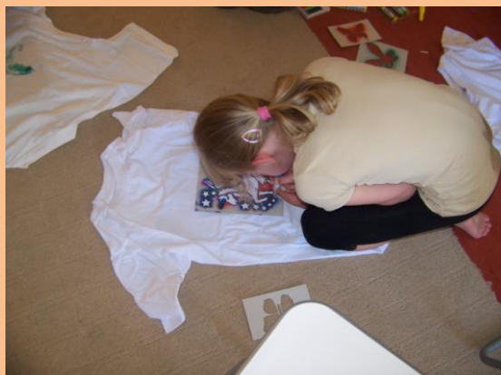
Obrázek 16: Foukání na textil

v plavbě kanálem na Vltavě, zbylo jim více času na vodní závody v kanoích. Strávená polovina dne se nám líbila a byli jsme spokojeni s praktickou ukázkou toho, jak se na vodě má člověk chovat a jak správně pádlovat, aby ujel co nejvíce za co nejmenší námahy.